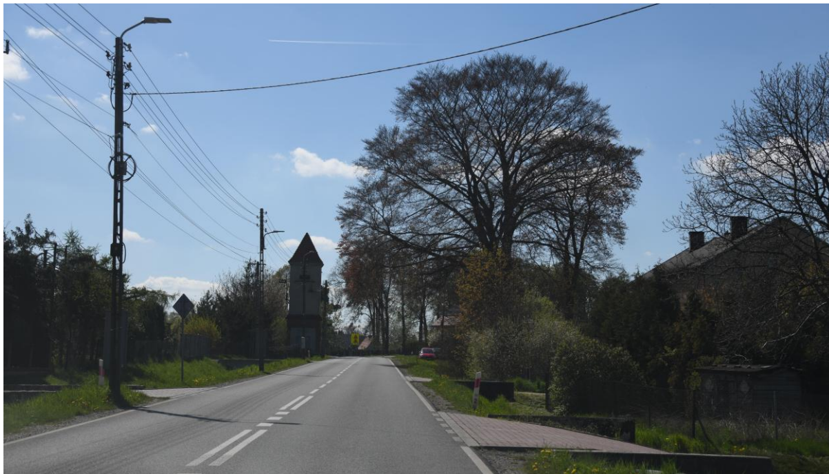
Wjazd do Toszka, od strony wschodniej, ul. Wielowiejska