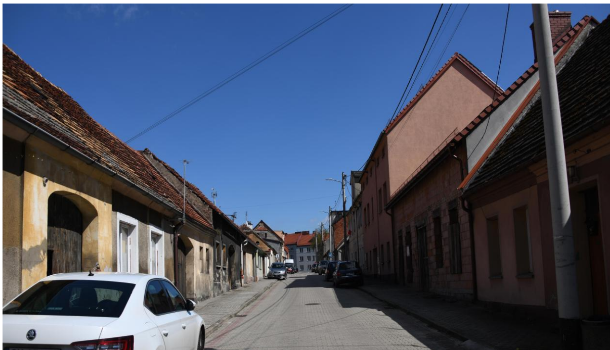
ul. Wolności o zachowanym dawnym charakterze niskich, gęsto ułożonych kamienic.