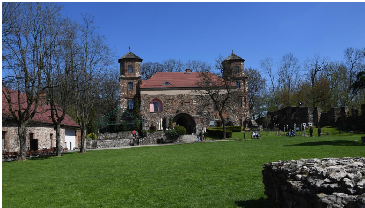
Zamek w Toszku. Zabytkowe założenie parkowo-zamkowe, ważne miejsce rekreacyjne