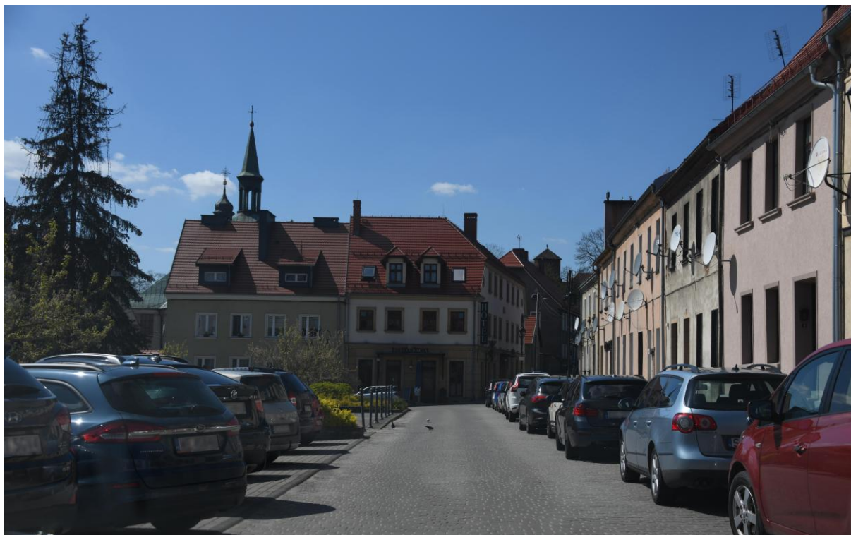
Rynek - historyczny układ kamienic